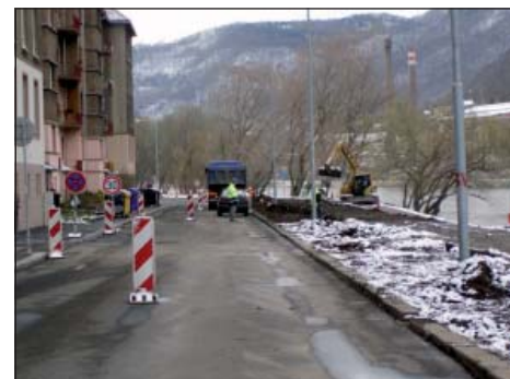
Stavba protipovodňové hráze foto 3.

vozidel doposud parkujících v dotčené oblasti. Stavbyvedoucí p. Šiška na setkání s občany, které se uskutečnilo dne 20. 2. 2008 v sále klubu SETUZA přislíbil, že se budou snažit realizovat stavbu tak, aby občany obtěžovali co nejméně. Přesto ale upozornil na skutečnost, že s ohledem na dobu výstavby musí plnit stanovený harmonogram výstavby, který předpokládá, že práce budou probíhat ve všední den od 7:00 do cca 17 spíše 18 hodin a v sobotu a v neděli nezapočnou dříve, než kolem 8 hodiny ránní. Současně vyzval občany ke zvýšené opatrnosti, neboť na stavbě se budou pohybovat těžké stavební stroje, nákladní automobily a další technika nutná pro realizaci stavby. Pan primátor na tomto setkání konstatoval, že stavba protipovodňového valu je jednou z velmi potřebných staveb, zejména pro MO Střekov, a že je