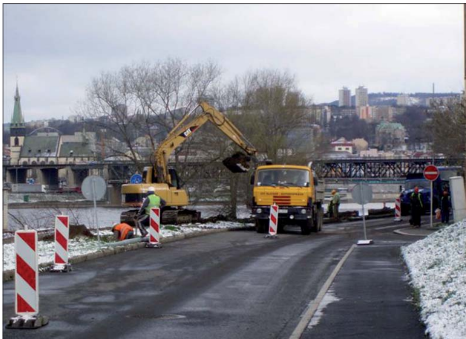
Stavba protipovodňové hráze foto 1.

Po úspěšném překonání všech úskalí spojených s výběrem dodavatele protipovodňových mobilních stěn může už město splnit své sliby dané občanům a postupně realizovat protipovodňová opatření. Dne 25.3.2008 bude zahájena dlouho očekávaná stavba protipovodňového valu na Střekovském nábřeží.