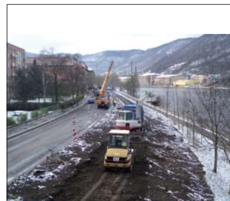
Stavba protipovodňové hráze foto 4.

snahou orgánů města i MO Střekov vytvořit optimální podmínky pro její realizaci. Požádal proto občany, kterých se stavební činnost přímo dotkne, o shovívavost a trpělivost a omluvil se předem za určitou míru nepohodlí a obtěžujících faktorů vyvolaných stavební činností. Současně přislíbil, že město zpracuje písemnou informaci, kterou ještě před započítím stavebních prací doručí každému do schránky. Dále vyzval občany, aby se v průběhu stavby obraceli se svými dotazy, požadavky a připomínkami na tajemníka ÚMO Střekov, který následně zabezpečí jejich projednání s vedením stavby nebo města.