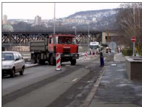
Stavba protipovodňové hráze foto 2.

Protipovodňový val bude vybudován v úseku od restaurace Rybářská bašta až k železničnímu mostu. Protipovodňovou ochranu obyvatel Střekovského nábřeží tvoří tři základní segmenty. Základ tvoří tzv. protipovodňový val, jehož podstatou je těsnící betonová stěna, která je konstruována tak, aby znemožnila průsak vody z Labe. Na této stěně budou zbudovány základy pro stavbu mobilní kovové stěny. Mobilní stěna, která je dalším segmentem protipovodňové ochrany, bude v době povodňového nebezpečí namontována na tento protipovodňový val. Celý systém bude z vnitřní strany hráze doplněn o záchytné jímky, které mají za úkol zachycovat a jímat např. dešťovou vodu z území za hrází. Tato voda bude následně systé-