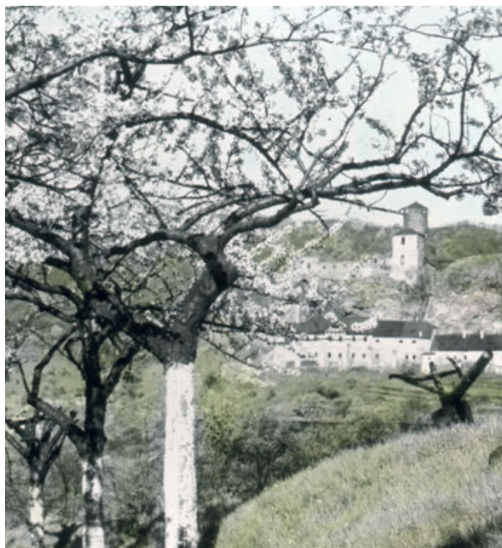
Pohled na hrad Střekov z rozkvetlého sadu (30. léta 20. století)