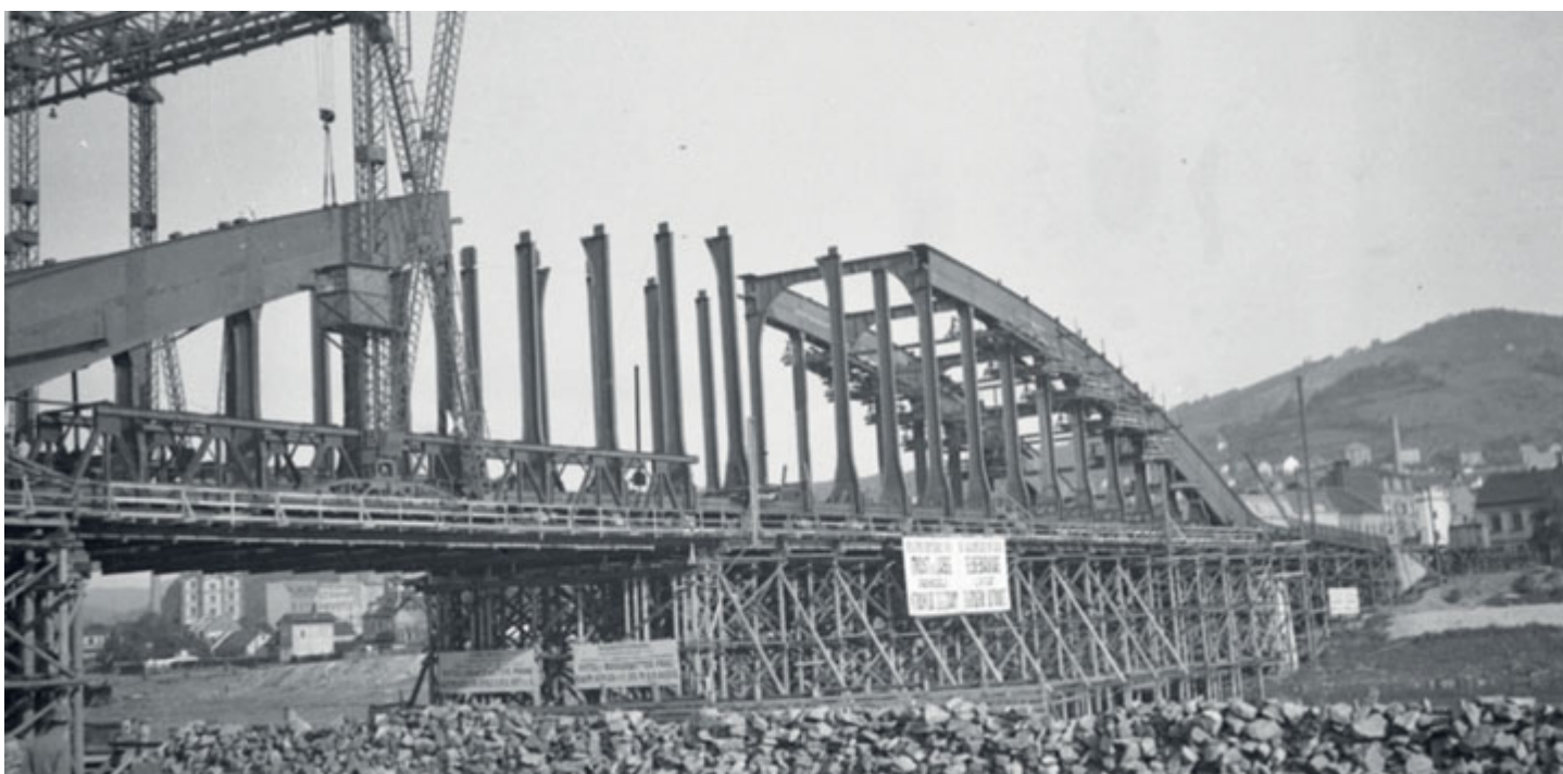
Rozestavěný most Dr. Edvarda Beneše ve druhé polovině 30. let 20. století