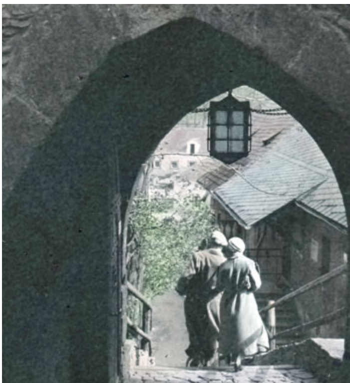
Postarší pár scházející z brány střekovského hradu ve 30. letech 20. století